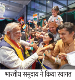
भारतीय समुदाय ने किया स्वागत