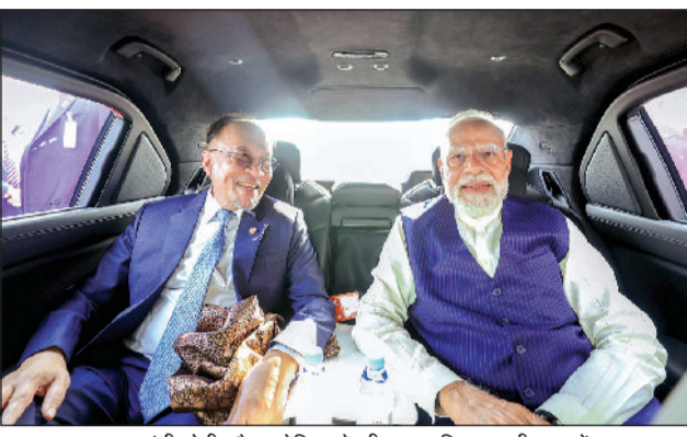
प्रधानमंत्री मोदी और मलेशिया के पीएम इब्राहिम एक ही कार में

प्रवासी भारतीयों से पीएम ने कहा कुआलालंपुर से कोच्चि तक एक जैसा खाना मलेशिया तक है भारत की फिल्में और संगीत की धाक