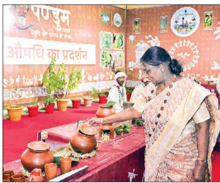
छत्तीसगढ़ के जगदलपुर में 3 दिवसीय आदिवासी सांस्कृतिक उत्सव बस्तर पंडुम 2026 में राष्ट्रपति।

राष्ट्रपति ने बताया कि डिजिटल धोखाधड़ी रोकने और उसकी शिकायत दर्ज कराने के लिए केंद्र सरकार ने कई कदम उठाए हैं। भारतीय साइबर अपराध समन्वय केंद्र, नागरिक वित्तीय साइबर धोखाधड़ी रिपोर्टिंग प्रणाली और साइबर धोखाधड़ी निवारण केंद्र बनाए गए हैं। उन्होंने कहा कि हम ऐसे समय में जी रहे हैं जब प्रौद्योगिकी अभूतपूर्व गति से विकसित हो रही है। ये तीव्र प्रगति गंभीर चुनौतियां भी ला सकती हैं, जिनमें साइबर सुरक्षा खतरे, डीपफेक, गलत सूचना और प्रौद्योगिकी पर बढ़ती निर्भरता शामिल हैं।