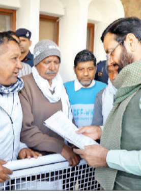
चंडीगढ़। सीएम नायब सिंह सैनी चंडीगढ़ स्थित अपने आवास संग कबीर कुंदर में लोगों की शिकायतों का निवारण करते हुए।

39 से 45 वर्ष आयु वर्ग के पुलिस कर्मी हैं, जिनमें कार्टरेबल, हेड कार्टरेबल और सहायक उपनिरीक्षक शामिल हैं। ये कर्मचारी करनाल, पानीपत, रोहतक, फरीदाबाद, गुरुग्राम, सिरसा, झज्जर, फतेहाबाद, पतनल, भिवानी, महेंद्रगढ़, रेवाड़ी, चरखी दादरी, हिसार, कुरुक्षेत्र और अंबाला सहित विभिन्न जिलों में तैनात हैं। सभी को वर्ष 2022 के लिए 35 प्रतिशत आरक्षित कोट के तहत सूची-बी। लोअर स्कूल कोर्स के लिए चयनित किया गया था, जिसकी शुरुआत 2 फरवरी 2026 से हरियाणा पुलिस अकादमी, मधुखन में होनी थी।