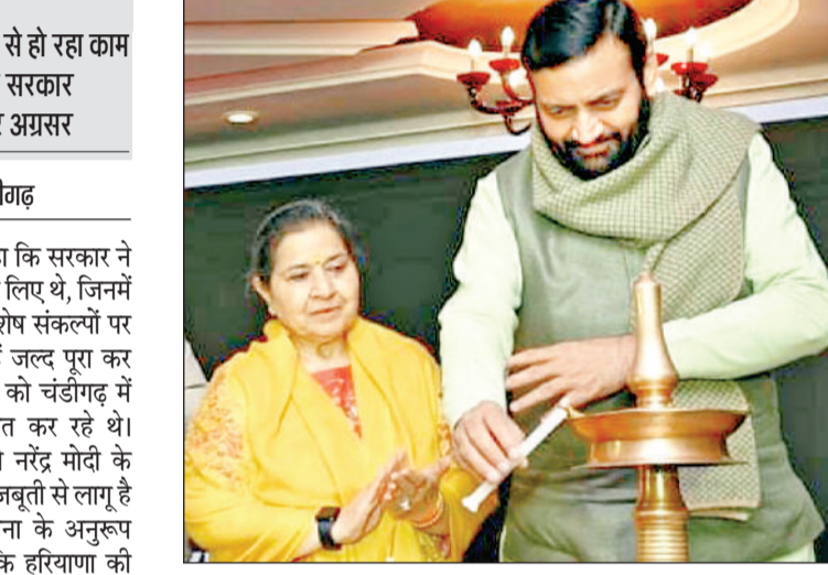
चंडीगढ़। दीप प्रज्वलित कर कार्यक्रम का शुभारंभ करते सीएम नायब सिंह सैनी।

मुख्यमंत्री नायब सिंह सैनी ने कहा कि सरकार ने अपने संकल्प-पत्र में 217 संकल्प लिए थे, जिनमें से 60 पूरे किए जा चुके हैं और शेष संकल्पों पर तेजी से काम चल रहा है, जिन्हें जल्द पूरा कर दिया जाएगा। मुख्यमंत्री शनिवार को चंडीगढ़ में आयोजित कार्यक्रम को संबोधित कर रहे थे। मुख्यमंत्री ने कहा कि प्रधानमंत्री नरेंद्र मोदी के नेतृत्व में देश का संविधान पूरी मजबूती से लागू है और सरकार संविधान की भावना के अनुरूप काम कर रही है। उन्होंने कहा कि हरियाणा की जनता ने भ्रष्टाचार-मुक्त और पारदर्शी शासन के लिए भाजपा को चुना है तथा प्रधानमंत्री नरेंद्र मोदी की नीतियों पर जनता का भरोसा लगातार बढ़ा है। इसी विश्वास के आधार पर राज्य में डबल इंजन सरकार को तीसरी बार बड़ा जनोदेश मिला है। राज्य में भर्ती प्रक्रिया को पूरी तरह पारदर्शी बनाया गया है, जिससे गरीब परिवारों के बच्चे भी बिना सिफारिश के सरकारी नौकरियां हासिल कर रहे हैं। शपथ ग्रहण से पहले ही 24,000 युवाओं को जॉर्निंग लेटर दिए गए और इस वर्ष भी बड़े स्तर पर भर्तियों का जा रही है। आयोग के माध्यम से भी भर्ती प्रक्रिया जारी है। सरकार सभी रिक्त पदों को पारदर्शिता के आधार पर भर रही है। मुख्यमंत्री ने कहा कि हरियाणा के युवा देश के अन्य राज्यों में भी अपनी प्रतिभा से स्थान बना रहे हैं और दूसरे राज्यों के युवा भी यहाँ अवसर पा रहे हैं। यह स्वस्थ प्रतिस्पर्धा का संकेत है।