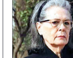
►► नई दिल्ली